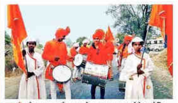
परपणी : सेवालयाच्या ढोलपथकाने ब्राह्मणणाव फाटा चेथे आयोजित धार्मिक कार्यक्रमाप्रसंगी सादगिकरण केले. यावेळी मुले मुली.