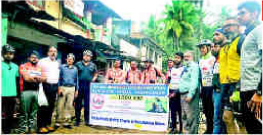
ापपणी। व्हें प्रधन सांजल यांच्या नेतृत्ववात्रानी आह वणांक्या समूते प्रष्ट्रा तेगाविषधी जनवाष्ट्रविद्यांचे वंगलेत ने केटाडयने कत्वाकृष्णी अन्त १००० किंतोपीटर ताव्यलन प्रवत पूर्ण केला. या वीन्वायओ प्रवीधिक श्री देवीर प्राण्डो, दे स्वेद्रवोठा प्रान्तिता, व्री. किंगण स्ववन, ज्ञानसा प्रविंग, केलाए छिठे, ओव तलोवा, स्वत जेव अन्ते सहयानी झाले होने.

My Partner/Hingol Page No. 51 Nov 04, 2017 Powared by: architecourt