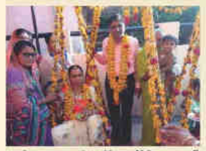
पासणी । अलालात्राणा चांडव, गांनी एकसर्टानिमिल खाधाग्याधनि तृत्व कारतना.