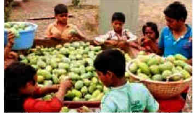
लातूर येथील सेवालय प्रकल्पातील आंबे परभणीत स्टॉल लावून विक्री करतानाचे दृश्य.

हासेगाव येथे एचआयव्ही बाधितांच्या पुनर्वसनासाठी सेवालय प्रकल्प सुरु करण्यात आला. शासन एचआयव्ही बाधितांना उपचारासाठी मदत करीत असले तरी पुनर्वसनासाठी मात्र ठोस पाऊले उचलत नाही. त्यामुळे एचआयव्ही बाधित युवकांचे पुनर्वसन व्हावे आणि ते स्वावलंबी बनून स्वतःच्या पायायर उभे रहावेत, या हेतूने हासेगाव येथे सेवालय प्रकल्पात उपक्रम सरु करण्यात