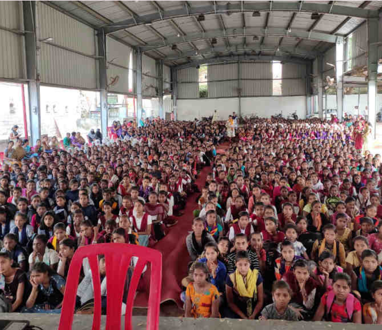
Homeopathic Academy of Research Charities (HARC) organized a program on menstrual hygiene management on 9th January 2020 at Sonpeth Tahsil, at which in a single day, more than 40 school's 1600 teenager girls were awarded. In this program, HARC donated free sanitary pads to 700 needy teenager girls.