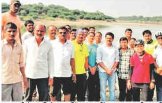
एचएआरसी संस्था आणि पेस सायकलिंग ग्रुपच्या वतीने मानवत तालुक्यातील रामपुरी येथे श्रमदान केले. याप्रसंगी ग्रुपच्या सदस्यांसह ग्रामस्थ.