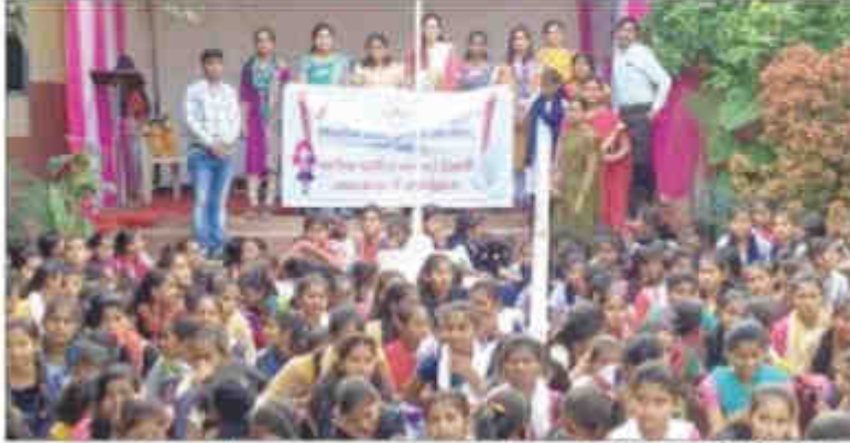
संवाददाता | परभणी

होमियोपैथिक अकादमी ऑफ रिसर्च एन्ड चैरिटीज संस्था की ओर से 2 जनवरी को पालम के ममता माध्यमिक विद्यालय में 43 वां किशोरियों के लिए समुपदेशन कार्यक्रम आयोजित किया गया। इस कार्यक्रम में ममता माध्यमिक विद्यालय, झकीर हुसैन उर्दू विद्यालय व पालम तहसील के जिला परिषद के विभिन्न स्कूल के 1242 किशोरियों ने उपस्थिति दर्ज की।