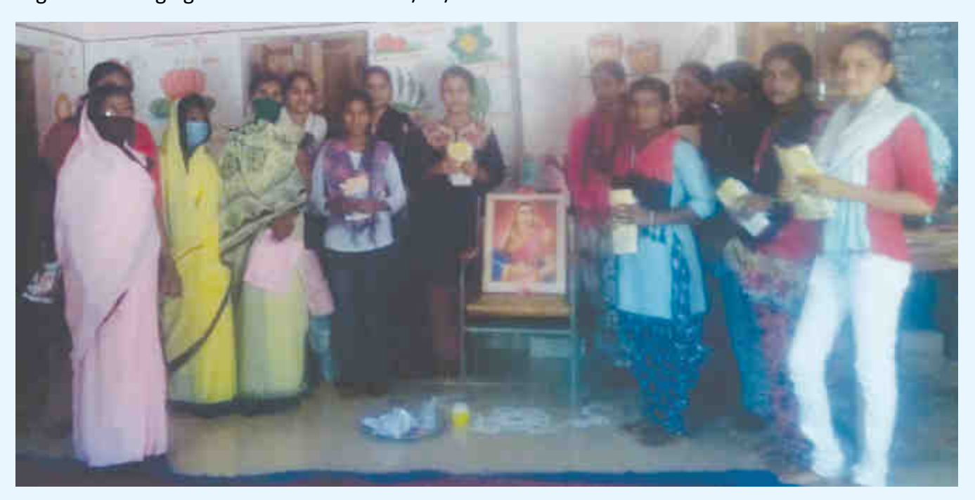
11) 150 Sanitary Pad & MHM leaflets Distribuited to Adolescent school girls & women at Zilha Parishad High School Bramhangaon tq Parbhani & Dist Parbhani on 22/01/2021